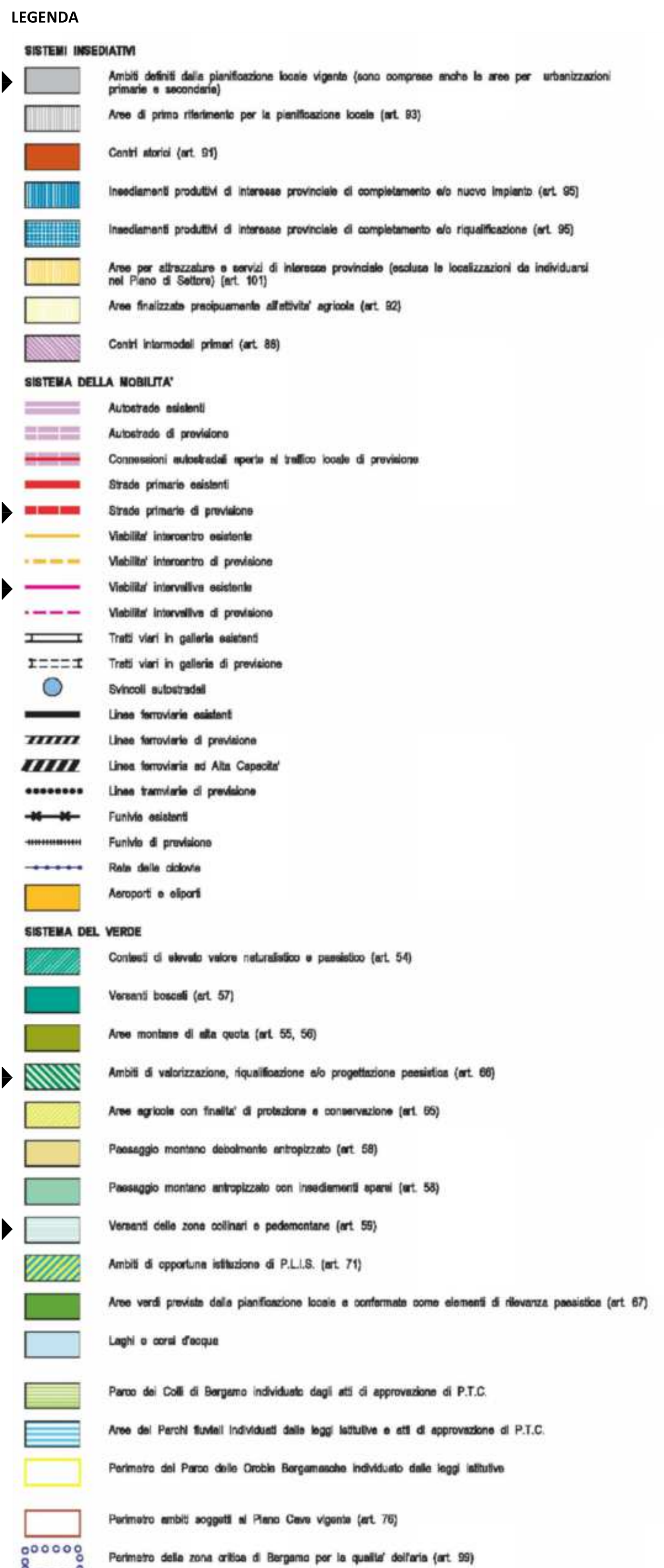
Estratto PTCP Scala 1:25000